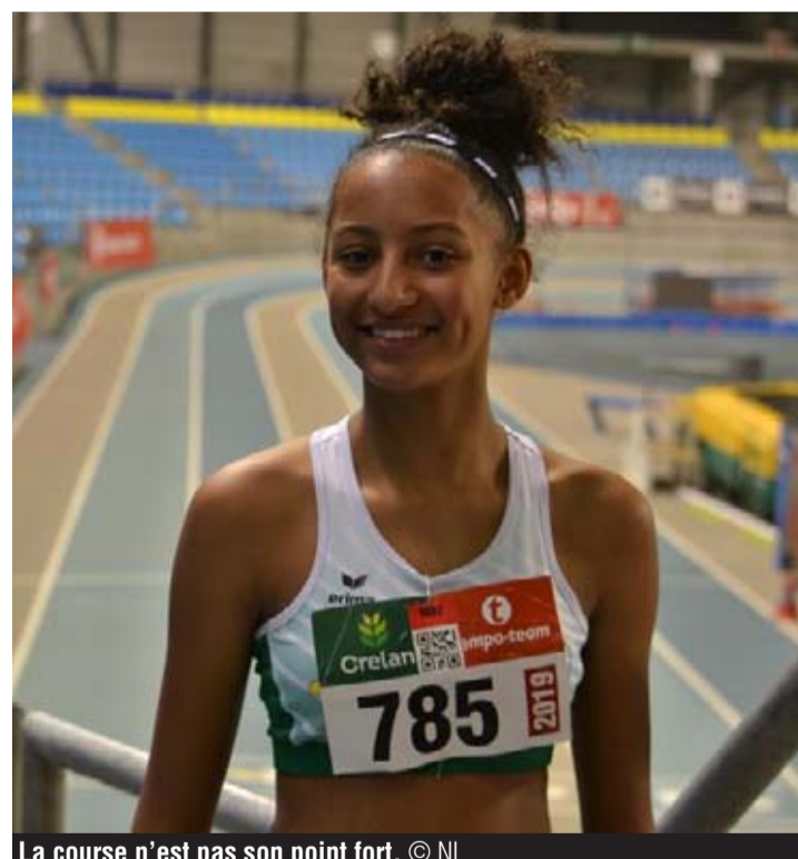
La course n'est pas son point fort.

Un pentathlon – soit cinq épreuves – qui avait démarré sur les chapeaux de roues. Une première course où elle parvient à dompter les obstacles sur les haies, un concours de hauteur et de poids bien géré avant de s'aligner en longueur, son épreuve de prédilection.