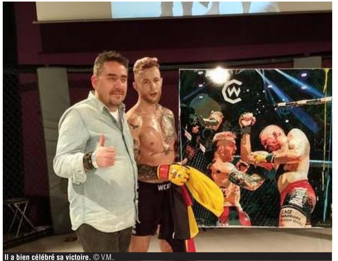
Il a bien célébré sa victoire.

taient avant moi. C'était clairement un plus pour moi et cela fait vraiment quelque chose de combattre dans une salle acquise à ma cause. De plus, la soirée a été très bien organisée. Tout s'est déroulé sans incident. On a été pris en charge du début jusqu'à la fin. Et même lorsqu'il nous manquait quelque chose ou qu'on avait des